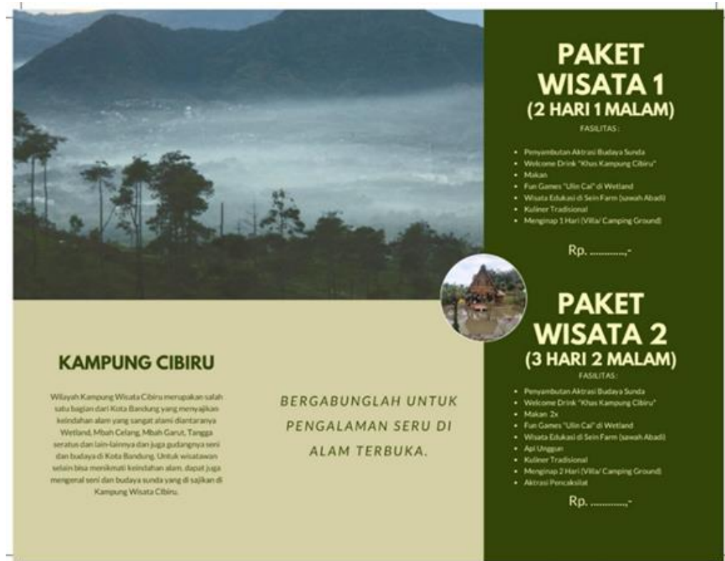
Gambar 3b. Paket wisata

Pola kegiatan pendampingan dilaksanakan dalam dua skema yakni luring dan daring untuk mensosialisasikan program kepada masyarakat.