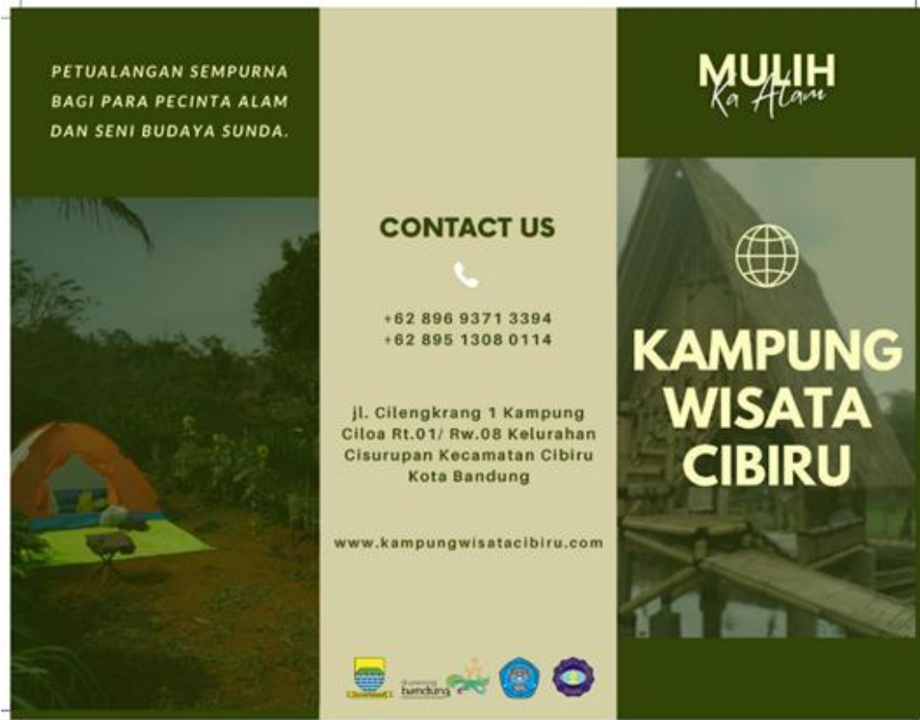
Gambar 3a. Brosur paket wisata