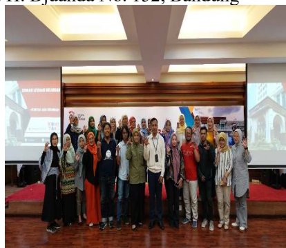
Gambar 1. Peserta dan narasumber pada saat pelaksanaan pendampingan edukasi literasi keuangan dan investasi Gen Z di Kelurahan Pasteur Kota Bandung Kantor OJK Provinsi Jawa Barat. Jl. Ir. H. Djuanda No. 152 Bandung.

Adapun kelebihanannya memiliki informasi lebih banyak, dan dapat melakukan banyak hal dalam satu waktu. Sedangkan kekurangannya adalah suka terhadap hal yang instan, dan terlalu bebas di media sosial, (2) Pengertian literasi keuangan versus Otoritas Jasa Keuangan (OJK), dampak kurangnya literasi, seperti salah mengambil keputusan, hingga terjerat investasi bodong. (3) Pengertian investasi, Pengenalan investasi legal dan aman, seperti saham, emas, deposito, reksadana, hingga properti, tingkat risiko yang ditanggung investor/pemilik; investasi bodong dan bagaimana dan tips menghindarinya yang bercirikan imbal hasil tinggi, namun minim risiko; perencanaan bisnis perusahaan jelas, terkait perusahaan maupun produknya yang bertempat di Kantor Kantor OJK Provinsi Jawa Barat. Jl. Ir. H. Djuanda No. 152; Bandung