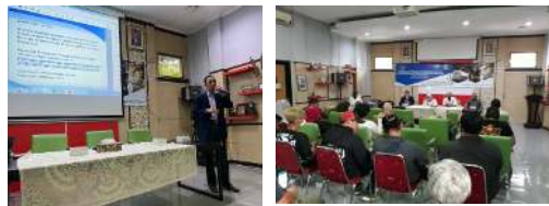
Gambar 1. Peserta dan narasumber dalam kegiatan pendampingan

Gambar 1 Peserta dan narasumber serta output yang dihasilkan pada saat pelaksanaan pendampingan tata kelola paket wisata budaya & sejarah di Kecamatan Lengkong Kota Bandung di Kantor Kecamatan Lengkong Kota Bandung Jl. Talaga Bodas No. 35 Bandung.